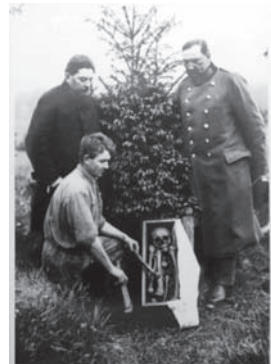
Сл. 13. Ситуациона скица гробља логора Броумов 1:250 [Архив Југославије 1921б]. Ексхумација посмртних остатака у Чехословачкој