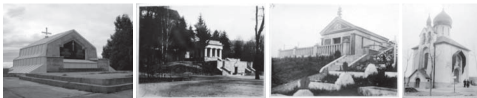
Сл. 1. Спомен-костурнице у Јиндриховицама (Чешка), Оломоуцу (Моравска), Тренчину (Словачка) и Олшанском гробљу у Прагу (Чешка).