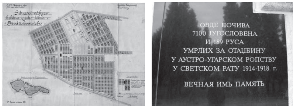
Сл. 11. Ситуациона скица гробља логора (1 : 200) и плоча на спомен-костурници у Јиндриховицама [Архив Југославије 1921а].

Међутим, ни до данас сва тела нису ексхумована. Поред ове спомен-костурнице, у једној шуми на око 5 км удаљености и сада постоји део гробља са око 1.600 гробова, од којих је преко 100 српских. Разлика се види и из броја гробних места и броја ексхумованих из гробља. Остали су највероватније Италијани, јер се „Италија држала назора да мртви треба да остану тамо где су сахрањени, док се Југославија приклонила француском начину решавања ратних гробља, а то значи ексхумацији и преношењу у костурницу” [Begenanová & Bružeňák 2012]. Али још увек велики број неексхумованих српских страдалника и даље лежи на гробљима, као што су она у Пардубицама (Pardubice) – 102, Опави (Opava) – 82, у Терезину (Terezín) – Алеја нација – 29, и др. у данашњој Чешкој Републици.